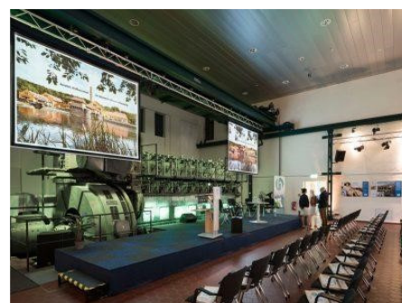
Tagung in der Dieselhalle